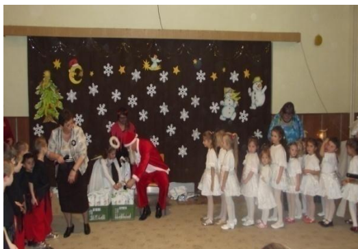
Vianočná besiedka