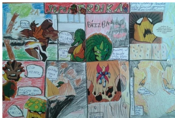
Obrázok - reprodukcia komiksu – autori – Adrián Sabo a Jakub Hrabčák 5.A

Podľa noviniek na www.zsbudkovce.edupage.org spracovala Otília Sabolová