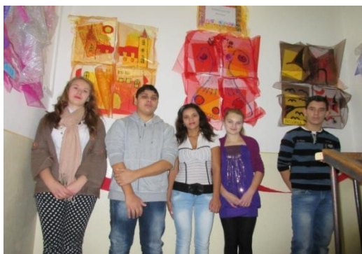
Autori vystavených diel