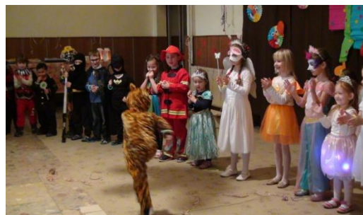
Karneval v MŠ