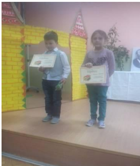
Školské kolo Hviezdoslavov Kubín