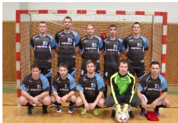
Naše futbalové A – mužstvo