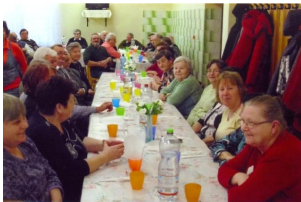
Stretnutie Klubu dôchodcov Budkovce