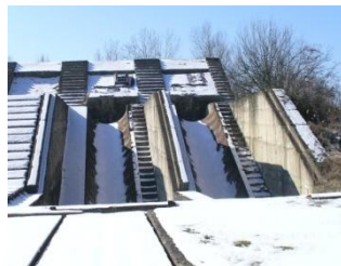
Prázdne miesta uloženia závitkových čerpadiel