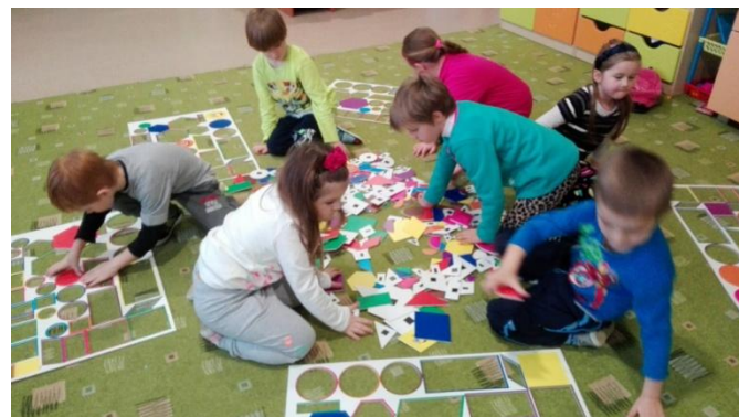
Hravá matematika