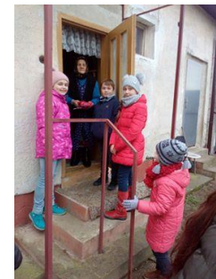
Krajšie Vianoce pre starkých v Budkovciach