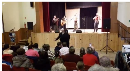
Skupina Drišľak – MDŽ v Budkovciach 2018