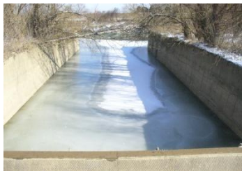
Vtkový kanál – prívod vody z Laborca