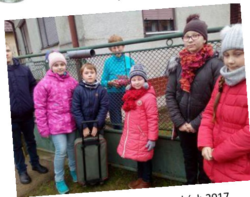
Krajšie Vianoce pre starkých 2017