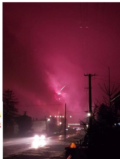
Ohňostroj Budkovce 2018