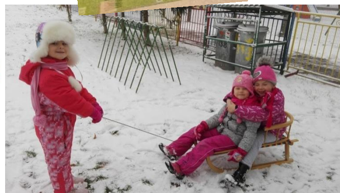
Zima, foto: Bc. H. Petrová