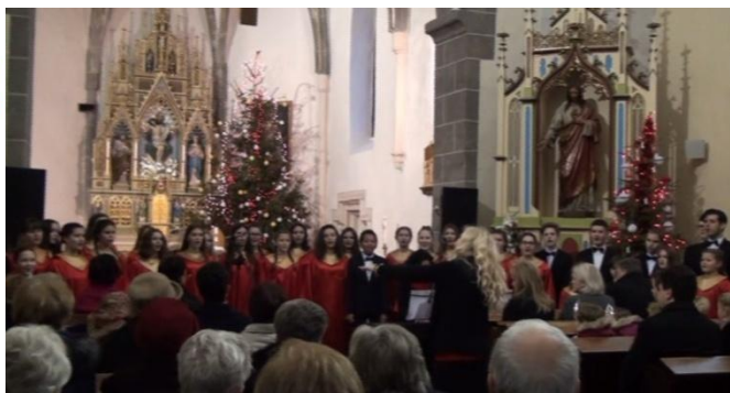
Detský spevácky zbor Pro musica Magnólia – 7.1.2018 v Budkovciach