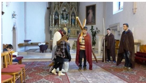
Hraná krížová cesta v Kostole Najsvätejšej Trojice, rok 2016, foto: P. Astrab