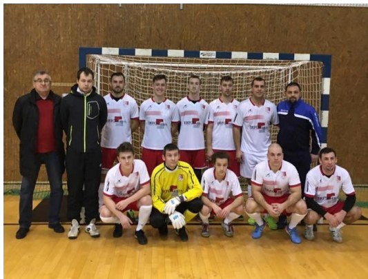
Zimný turnaj ObFZ .

Ďalej pokračujeme aj v pohári, prvý semifinálový zápas s Tušicami TNV je na programe 5.4. o 16.30 v domácom prostredí. L. Ložanský