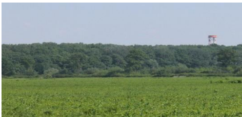
Výčnievajúca veža ponad 135 ha Dolný Les - Budkovce