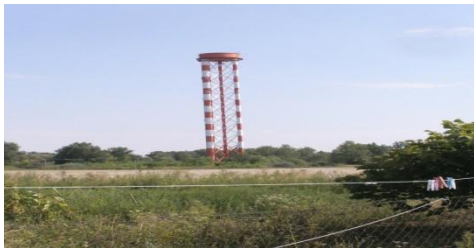
Vežový vodojem – pohľad z osady

Na pomedzí chotárov Stretavka a Budkovce, pri osade Dolný Les - Budkovce bol v deväťdesiatych rokoch minulého storočia vybudovaný závlahový systém, tzv. závlaha pozemkov Východoslovenskej nížiny č.5, ktorý patril do celkového komplexu závlah VSN. Závlahový systém bol zásobovaný vodou z rieky Laborec, maximálne piatimi závitkovými čerpadlami bola voda dopravovaná do vodojemu. Ovládanie čerpadiel bolo automatické v závislosti na hladinách vo vežovom vodojeme. Rozvod závlahovej vody bol vedený samospádom, oceľovými potrubiami s priemerom od 1,80 m až po priemer 40 cm, ktoré sú uložené v zemi s metrovým krytím zeminou, k jednotlivým prípojným miestam. Dnes z modernej závlahy zostali iba zakopané potrubia v zemi a vežový vodojem.