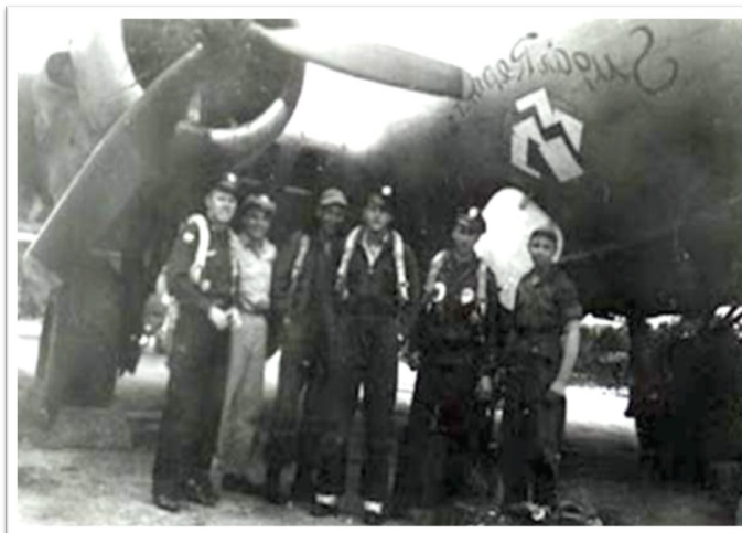
Maľba na nose bombardéru B-17G 44-8186 nazvaného „Sugar Report“