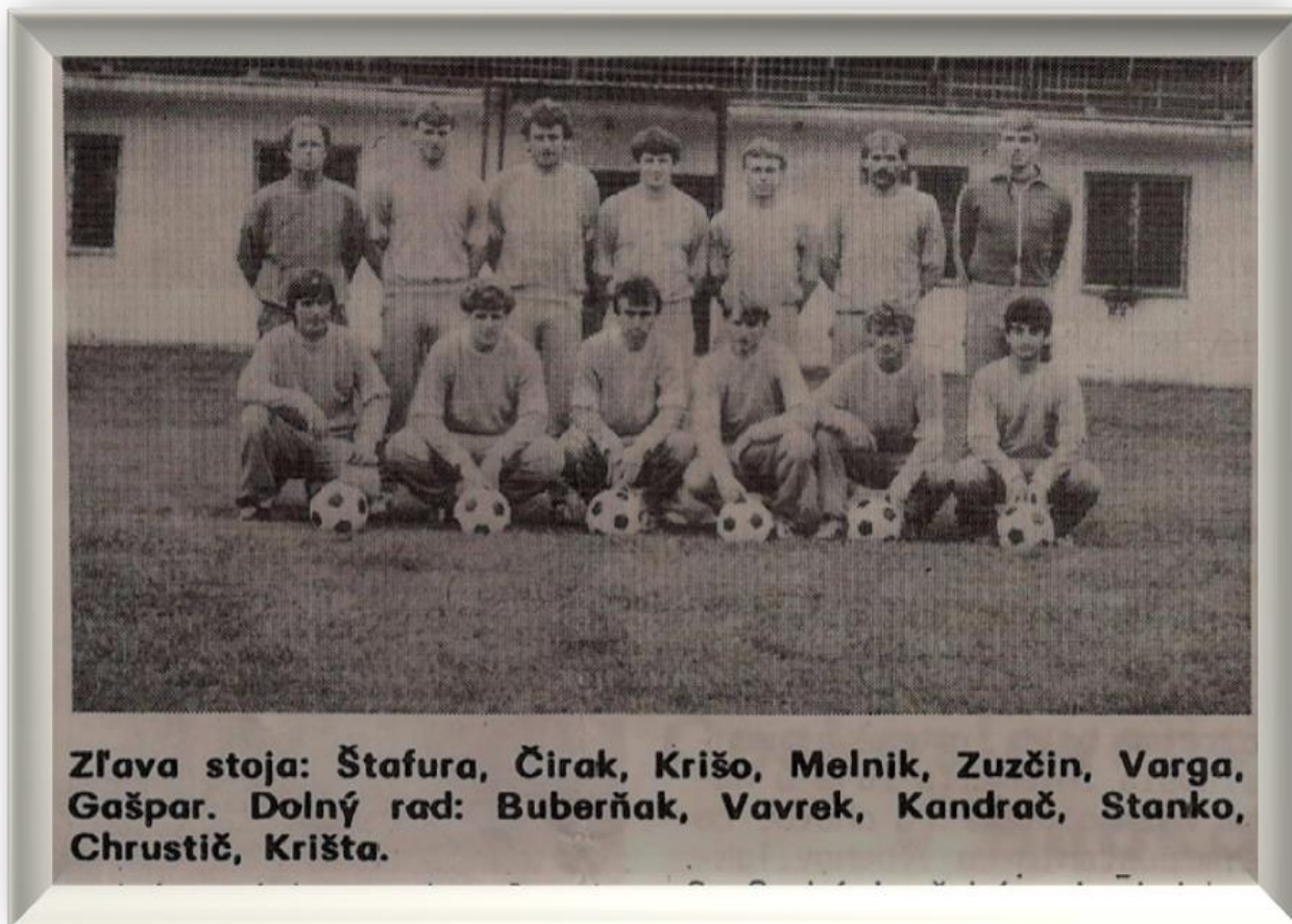
Mužstvo, ktoré pôsobilo 1.rok po postupe do II.SNFL